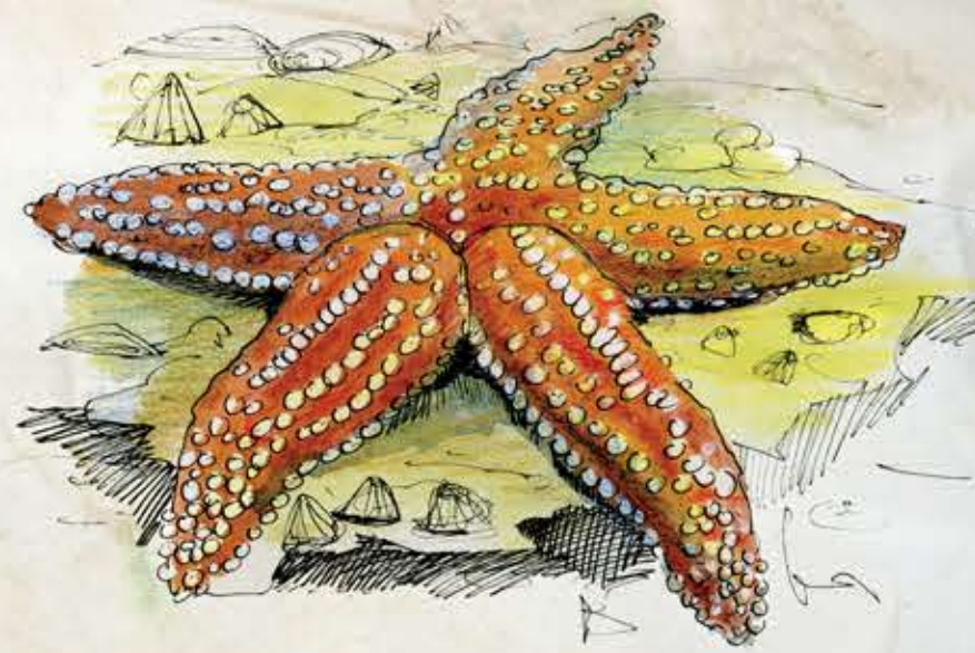
Étoile de mer

Le fort courant marin lié à l'effet de détroit, entre Manche et mer du Nord, diversifie les milieux. Une myriade de mollusques, d'oursins et d'étoiles de mer occupent les bancs de sables sous-marins.