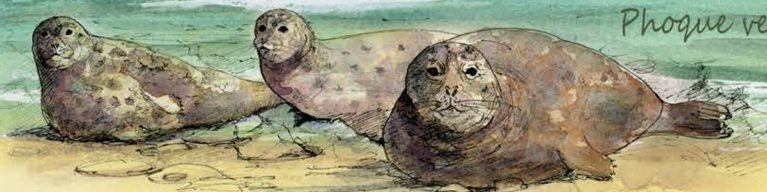
Phoque veau marin